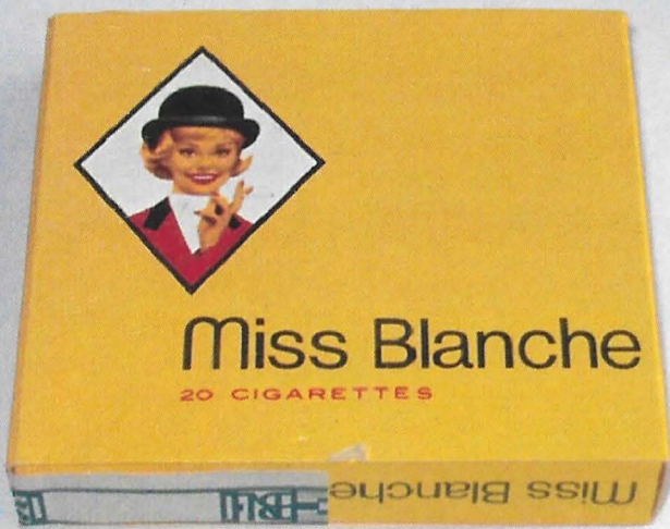
Afbeelding 2 Zie: "Het kastje van de horlogemaker" p. 2089