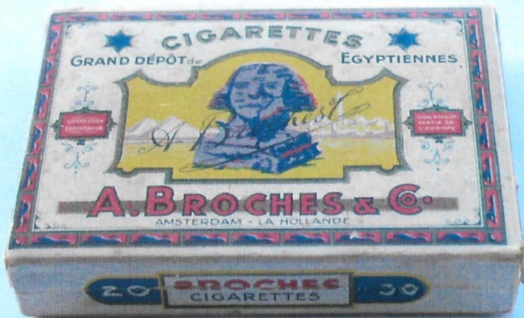
Afbeelding 4 Zie: "Het kastje van de horlogemaker" p. 2090